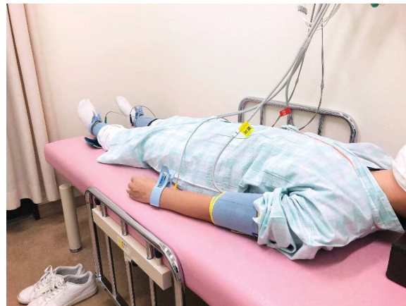
ABI 検査（上腕・足関節血圧比）