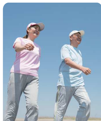
運動療法（ウォーキング）