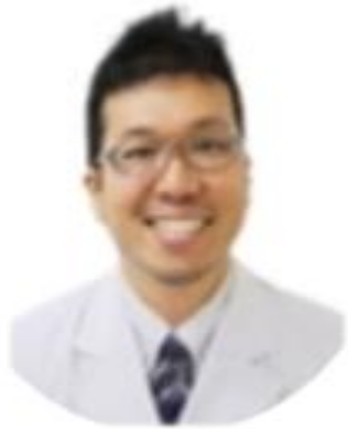
救急・集中治療科 科長