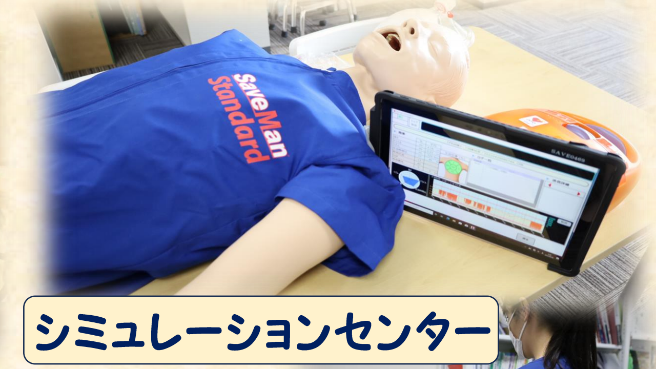
シミュレーションセンター