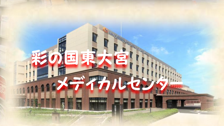
彩の国東大宮 メディカルセンター